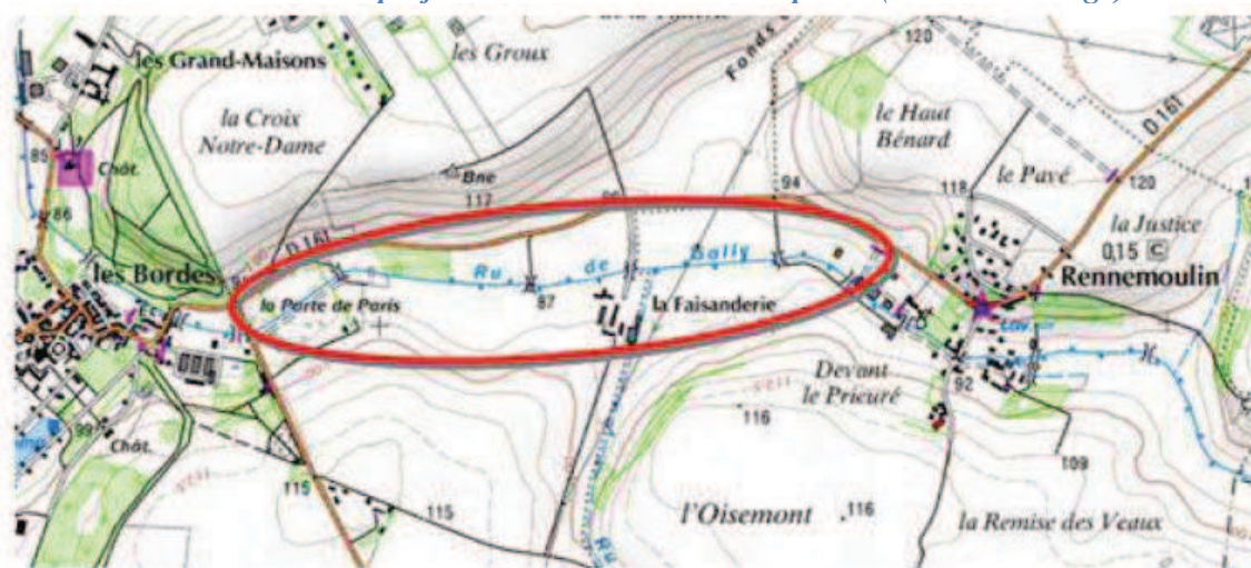
Localisation du projet sur la commune de Villepreux (amont du village)

Le projet est situé : communes de Villepreux et Chavenay dans les Yvelines