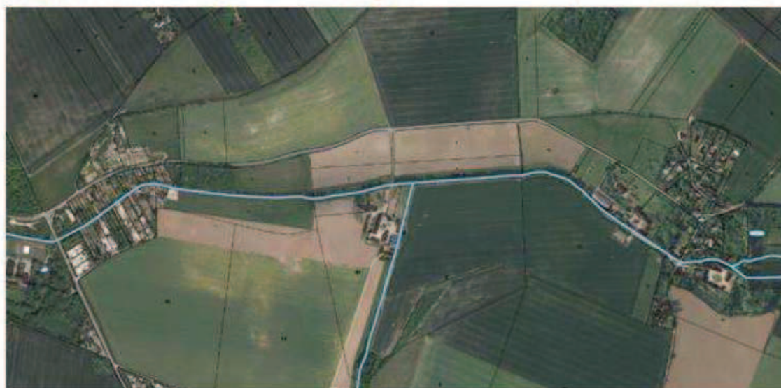
Localisation du projet sur la commune de Chavenay (amont du village)