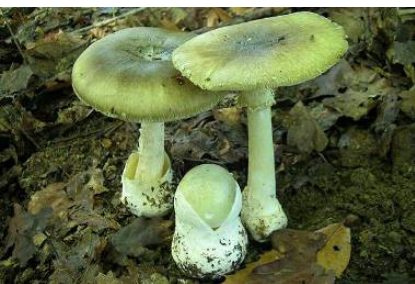
L'amanite phalloïde est un champignon mortel