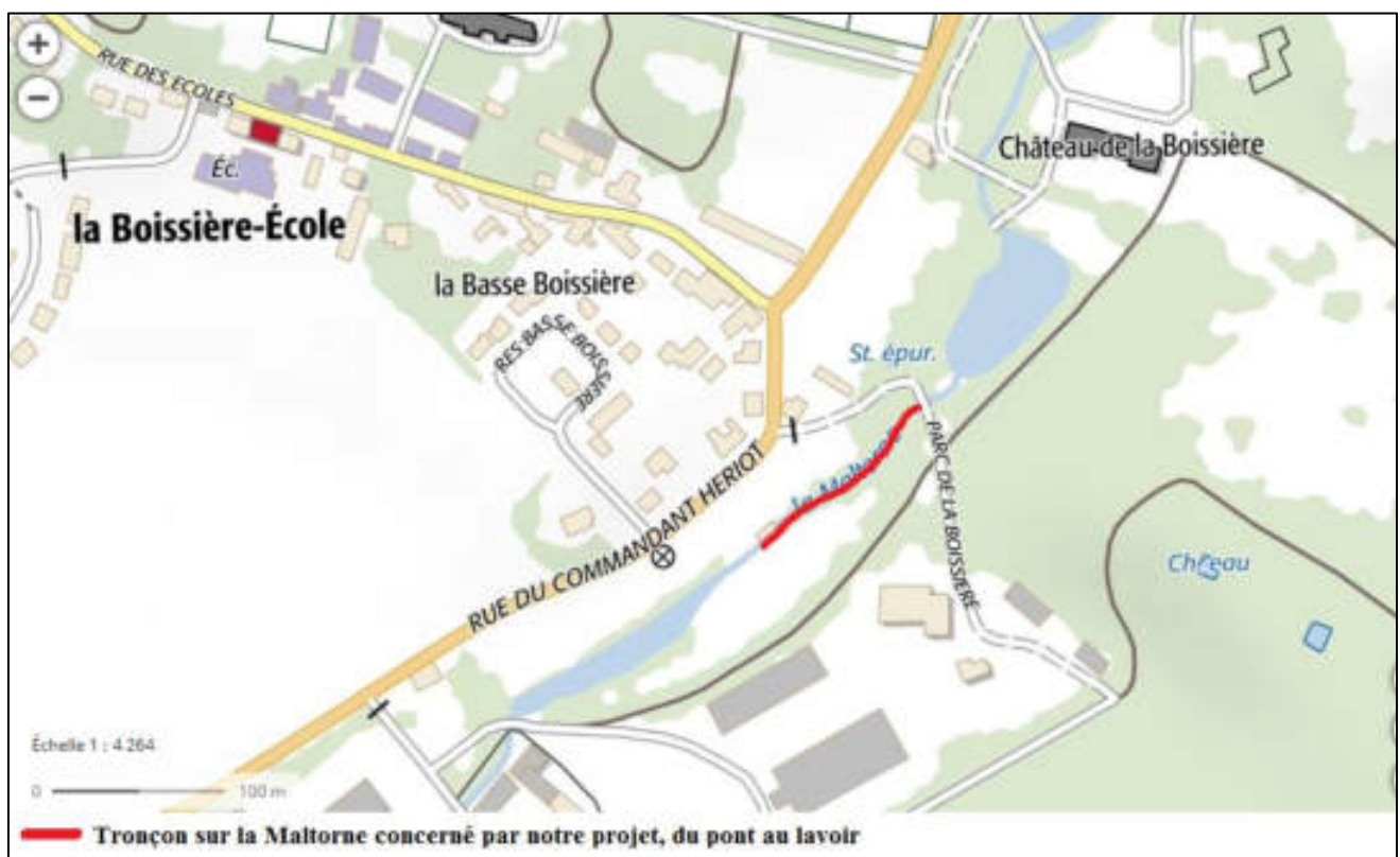
Plan de situation du tronçon de la Maltorne objet du présent dossier