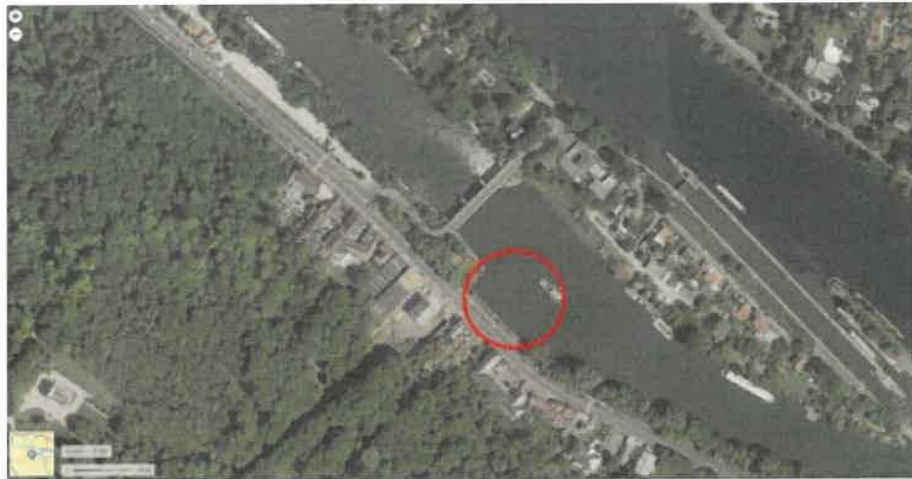
Vue aérienne actuelle avec l'emplacement du site de la Machine Chef Cécopmetal