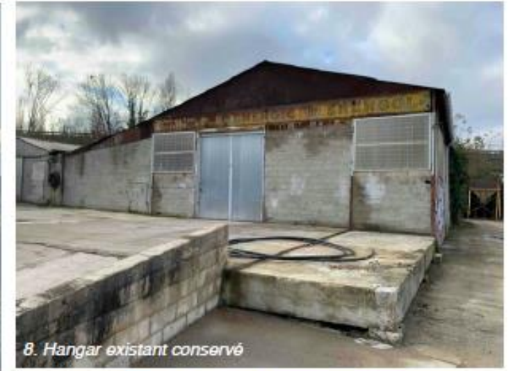
8. Hangar existant conservé