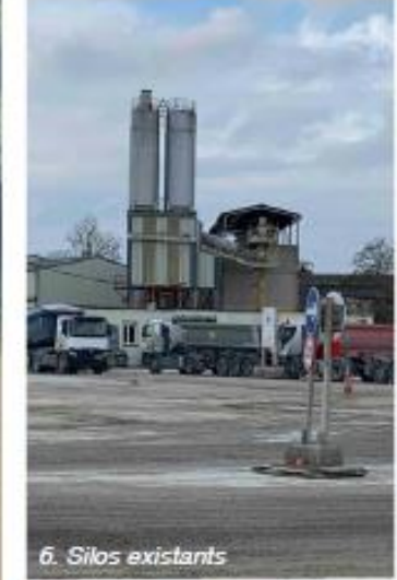
6. Silos existants