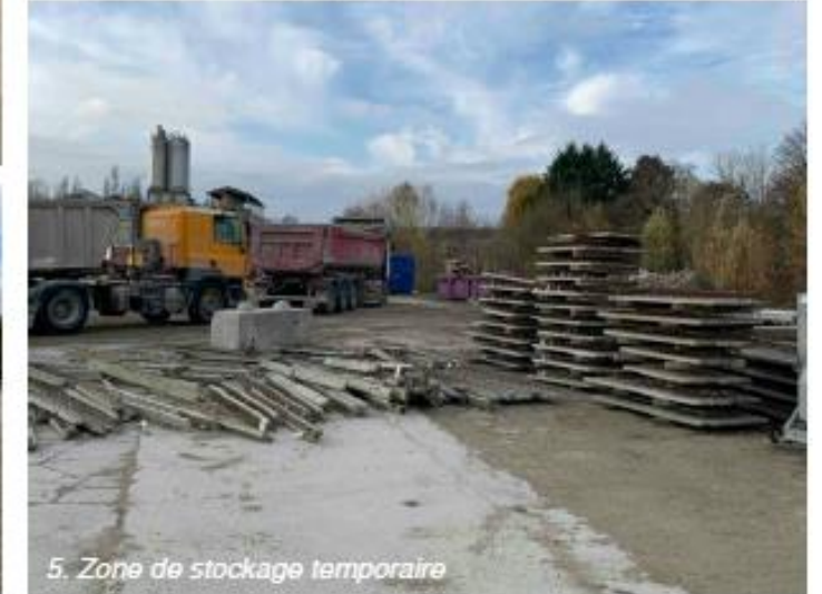
5. Zone de stockage temporaire