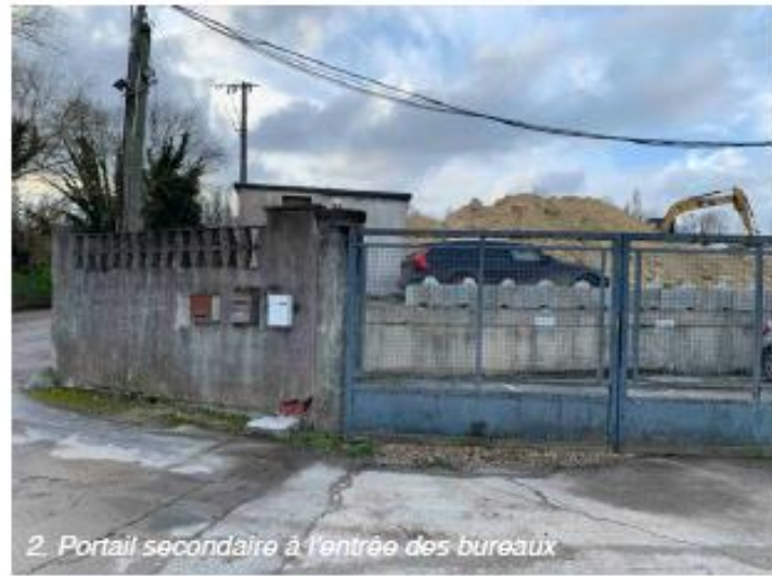
2. Portail secondaire à l'entrée des bureaux