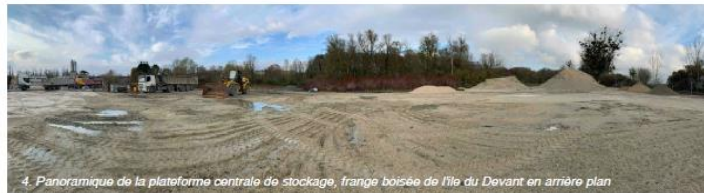
4. Panoramique de la plateforme centrale de stockage, frange boisée de l'île du Devant en arrière plan