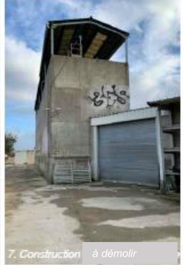
7. Construction à démolir