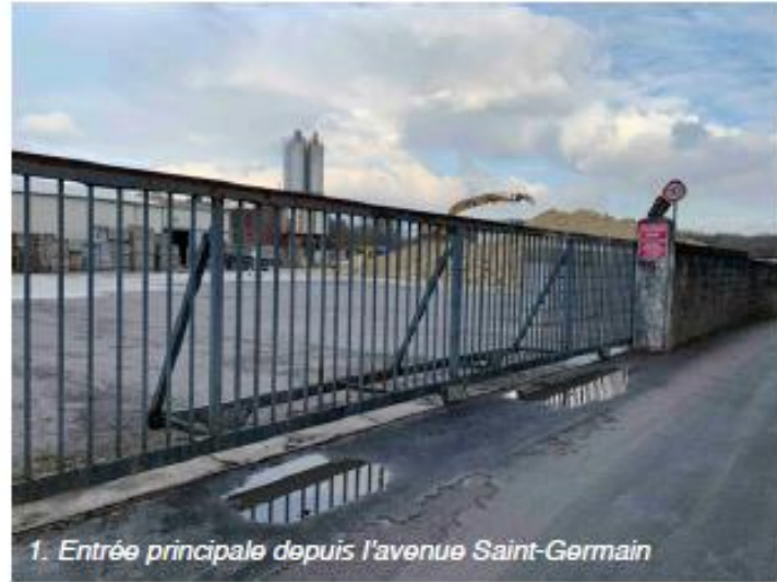
1. Entrée principale depuis l'avenue Saint-Germain