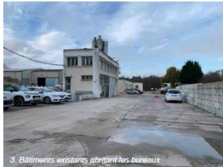
3. Bâtiments existants abritant les bureaux